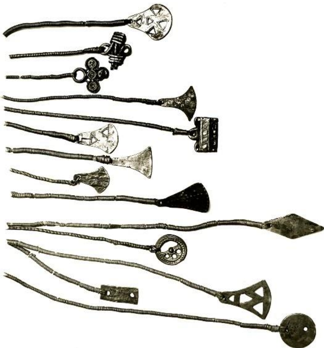
Et utvalg av amuletter. Foto: Anton F. Köhler 1932.

har en mye større andel av kjeder festa i enden.