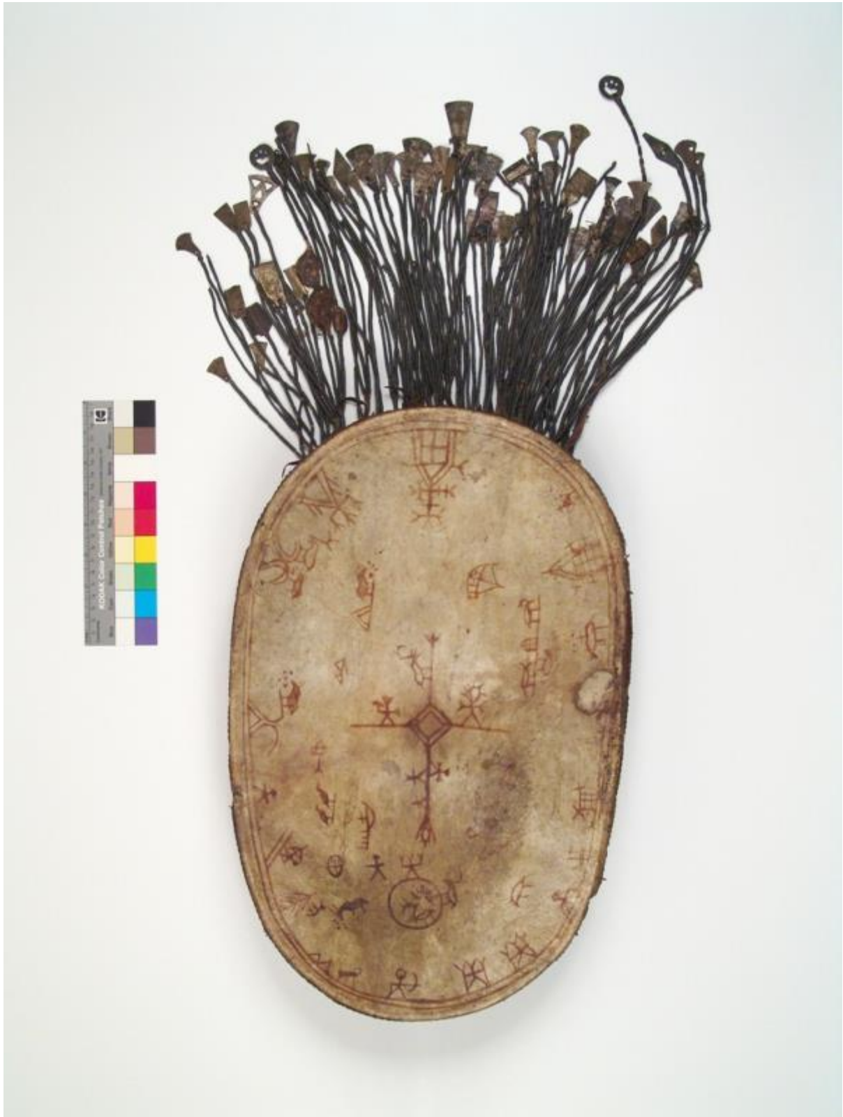
Runebomma fra Folldalen.

Det var derfor ikke uten grunn at eksperter innen etnologi, særlig spesialister på rune- bommer ble tiltrukket av denne tromma på tidlig 1900-tall.