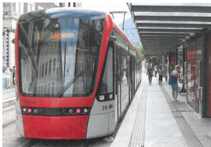
Nasjonale forventninger til regional og kommunal planlegging 2019–2023

Lokale myndigheter har sentrale oppgaver men å håndtere disse utfordringene, og det gjelder alle kommuner, uavhengig av størrelse. Planlegging er kommunenes viktigste verktøy.