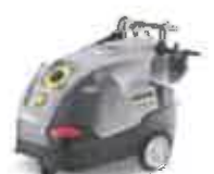
Bkhengeren - Husqvarna - Kärcher

Siste nytt: Best i test TV2: Husqvarna ST327P