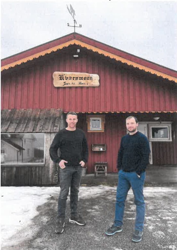
Bilde fra fjøset på Hognes

"Jeg kan bare sterkt anbefale å ansette ukrainere. Det eneste en arbeidsgiver kan miste hvis det ikke fungerer, er tid. Disse menneskene som kom fra Ukraina har mistet alt. De fortjener virkelig denne sjansen."