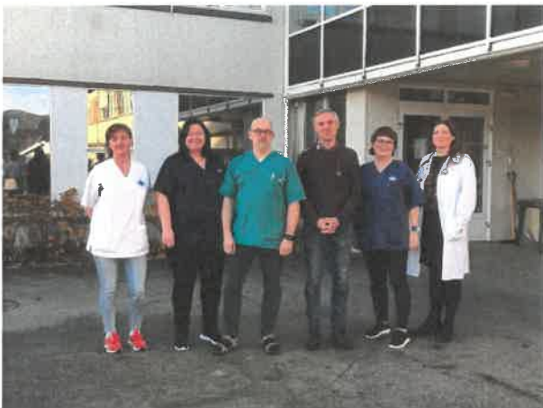
Vårt team på legekantoret fra nyttår.

For bestilling av time til vaksiner, ta kontakt med Høylandet legekantor 74 32 49 00