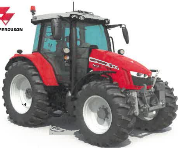
MASSEY FERGUSON 5700S-SERIE MASSEY FERGUSON 7700-SERIE