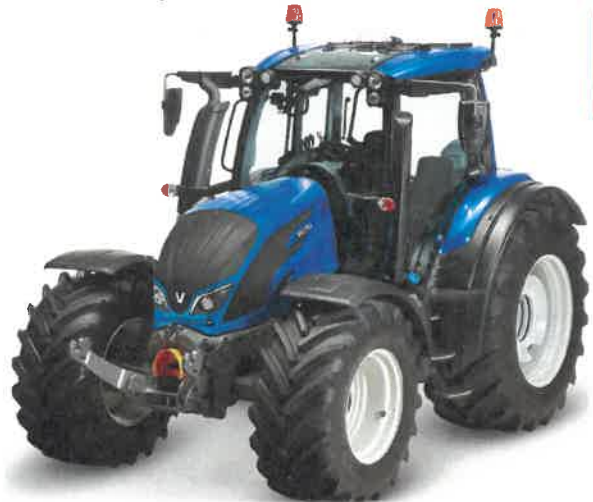
VALTRA N-SERIE VALTRA A-SERIE (H4 TRANSMISJON)