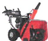
SNØFRERER ST 324P 23.099,-