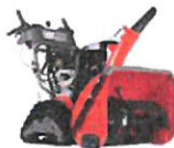
SNØFRERER ST 327PT 30.449,-