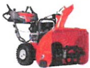
SNØFRERER ST 227P 16.249,-

KRAFTIG OG STORE SNØFRERSERE FOR SMÅ OG STORE AREALER