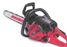
Jonsered 2253W Kr. 7.649,- -innbytte kr. 1.500,-