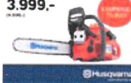
HUSQVARNA 445 3.999,- (i ppm.)