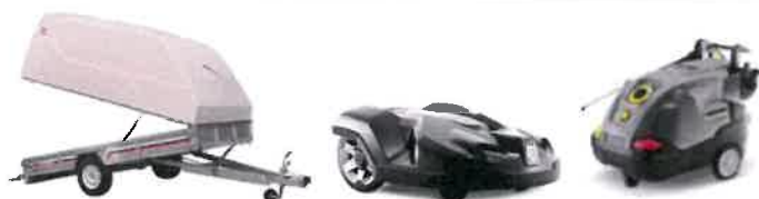
Bkengeren - Husqvarna - Kärcher