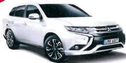
Mitsubishi Outlander hybrid 2016 Terningkast 6 i VGtest 1/12-15